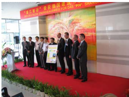
Bild 1: Bundesbauminister Wolfgang Tiefensee hat am 21. September 2006 den ersten Gebäudeenergieausweis Chinas für das Pujiang Office Building in Shanghai übergeben.