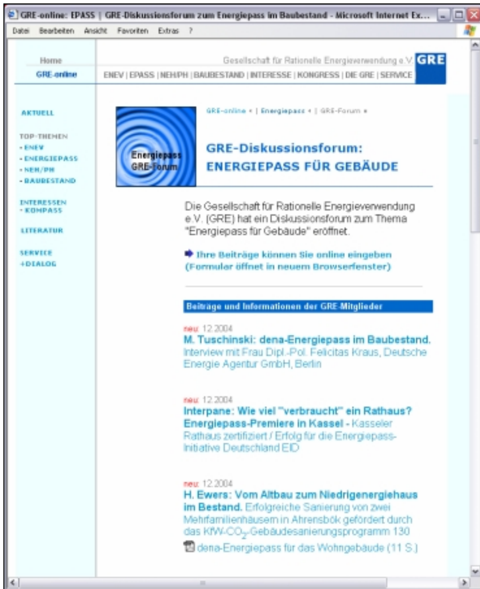
Bild 1: Bildschirmansicht des „GRE-FORUM ENERGIEPASS“ im Internet unter: http://www.gre-online.de/epass/forum/ .

2004 hat die GRE zu dem Thema „Energiepass für Gebäude“ ein spezielles Forum eingerichtet, wie auf nachfolgendem Bild ersichtlich ist.